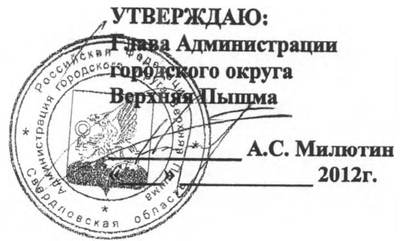
ГРАФИК Подачи питьевой воды на город Верхняя Пышма на 2012 г.